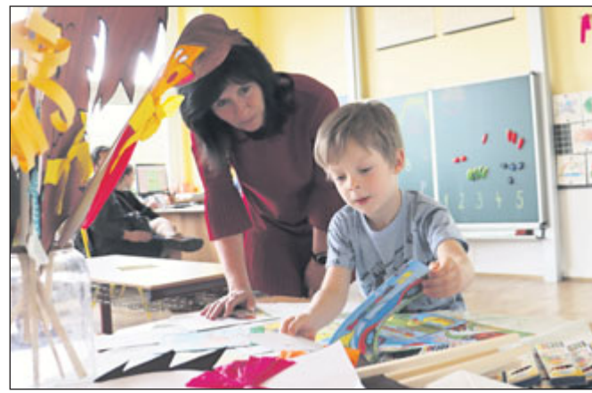
Zápis prvňáčků na ZŠ Lerchova. K zápisu přišly také děti z přípravné třídy.