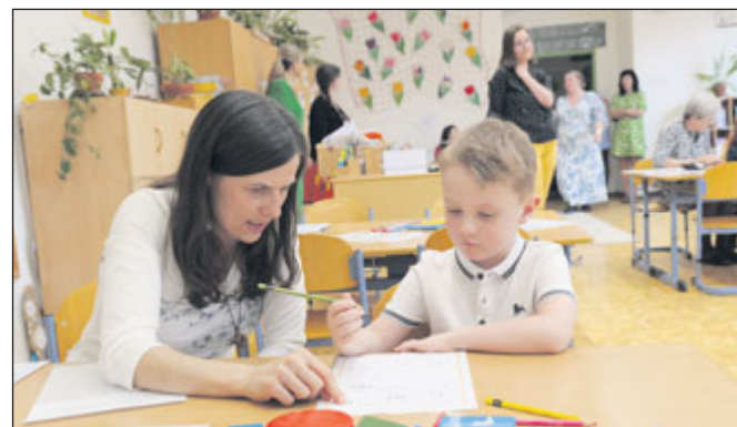
Zápis do 1. třídy – ZŠ T. G. Masaryka, pracoviště Komenského 59