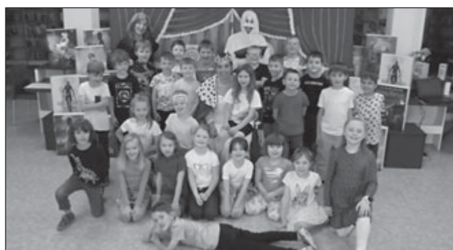
ZŠ Lerchova, 1. C

V městské knihovně se konala slavnostní událost - prvníáci místních základních škol byli pasováni na Rytíře/Rytířku slova, což symbolizuje jejich první významný krok ve světě čtení a psaní. Přejeme jim mnoho příjemných chvil strávených s knihou, která je zavede do světa plného dobrodružství, fantazie a nových poznání.