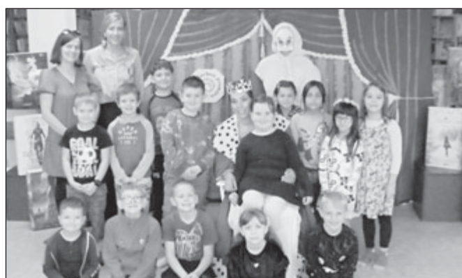
ZŠ Komenského, 1. E