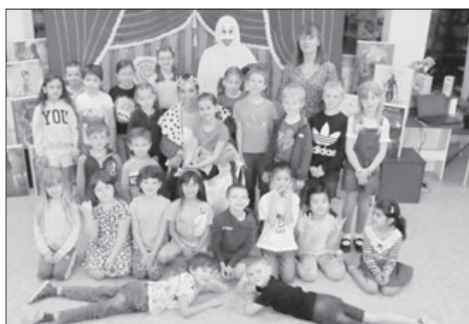
ZŠ Lerchova, 1. B