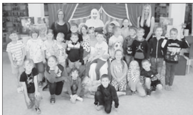
ZŠ Lerchova, 1. A