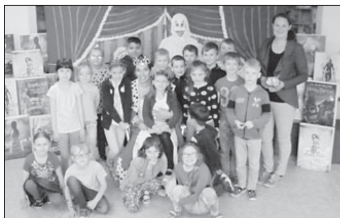
ZŠ TGM, 1. A