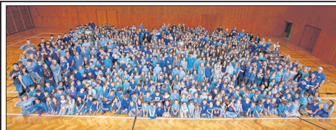
MODRÝ DEN – ZŠ Sušice, Lerchova ul. přeje všem krásné prázdniny!