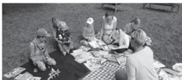
V případě špatného počasí se Vaším dětem budeme věnovat v knihovně v oddělení pro děti a mládež. Městská knihovna Sušice - oddělení pro děti a mládež, Klostermannova 1230, Sušice

Knihovnice přijde na Vaše oblíbené hřiště číst a hrát si s dětmi. TĚŠÍME SE NA VÁS!