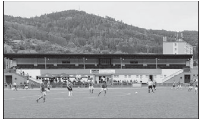
Sušické béčko v zápase se Svěradicemi, který vyhrálo suverénně 5:1.

„Trochu jsme pozměnili sestavu a vsadili na klasické rozestavení 4-4-2. Do útoku jsme poslali kapitána