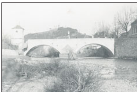
Kamenná část mostu přes Otavu s kapličkou a schovou Jana Nepomuckého a níže kaple Anděla Strážce.