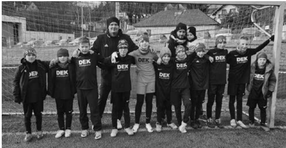
Tým starší přípravy na domácím turnaji Zimní ligy

• TJ Sušice – Mýto 4:2 (2x Kočí, Mička, Skrbek)