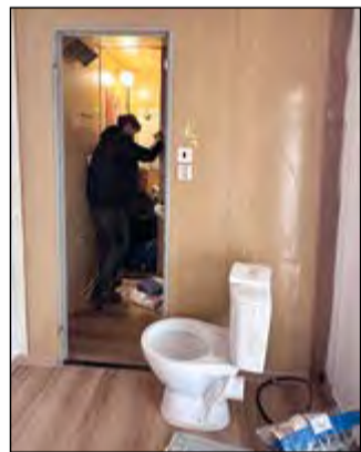
Přípravy bytu pro dalšího nájemníka v domě v ulici Kaštanová.

O větší byty nad 80 m 2 (2+1, 3+1 a 4+1) se soutěží obálkovou metodou. Minimální sazba zůstává 52,86 Kč/m 2 , průměrná vysoutěžená cena za rok 2024 činila