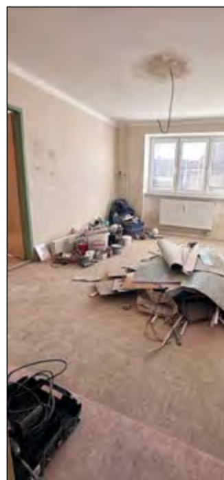
Průběh a výsledek rekonstrukce městského bytu v Lerchově ulici.